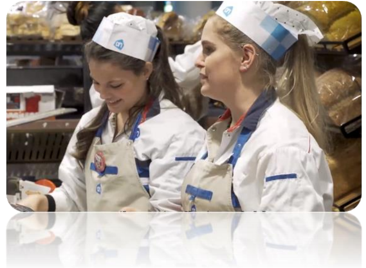
foto gemaakt in niet corona-tijd. Toen we nog niet de 1,5 m samenleving hadden.