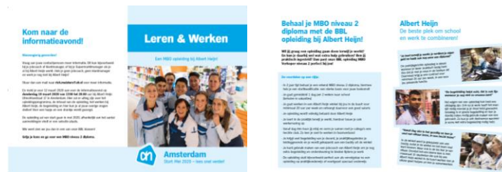
foto gemaakt in niet corona-tijd. Toen we nog niet de 1,5 m samenleving hadden.