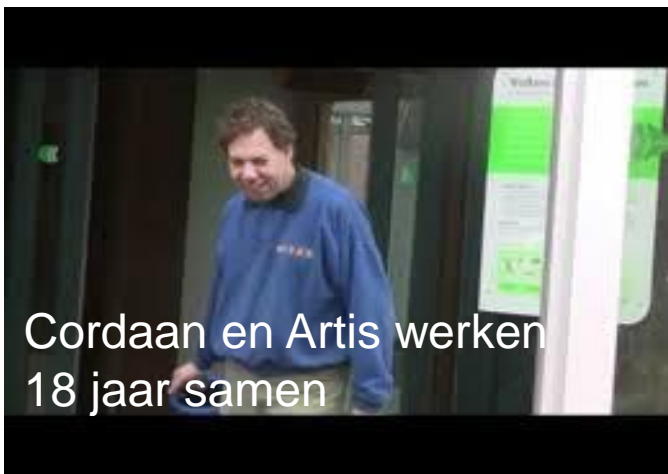
Cordaan en Artis werken 18 jaar samen