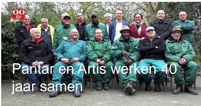
Pantar en Artis werken 40 jaar samen