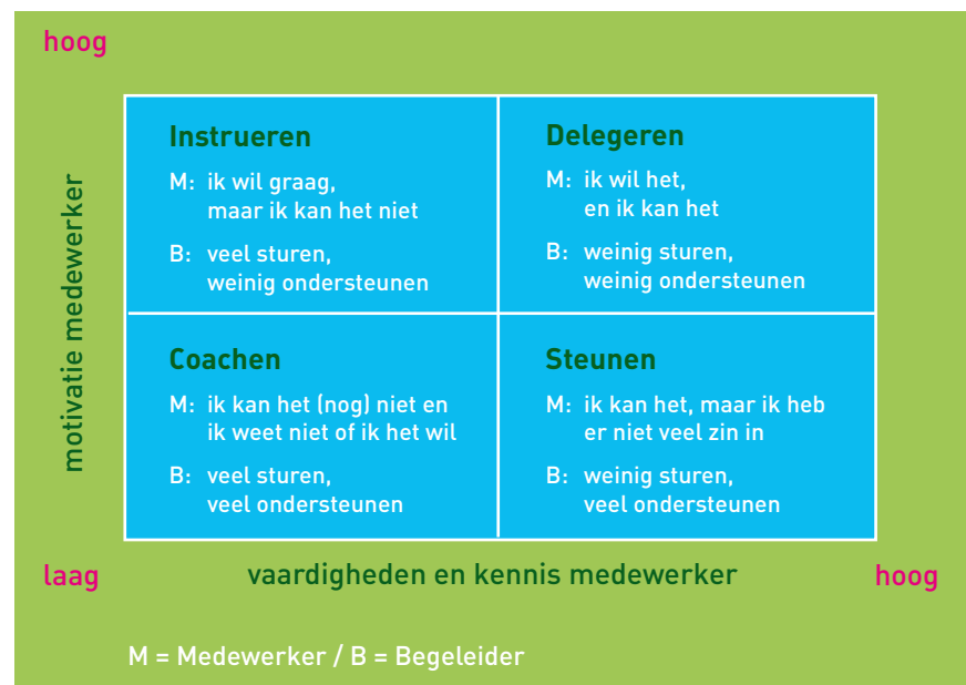
Figuur 2: Begeleidingsstijlen en -behoeften

Stap niet in de valkuil om acties en/of beslissingen van de medewerker over te nemen. Geef hem de ruimte om zich zelf te ontwikkelen. Doe dit echter met kleine stapjes en informeer bij de medewerker of dit goed gaat.