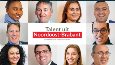
Talent uit Noordoost-Brabant